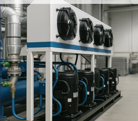
سلسلة التبريد والمرافق الصناعية